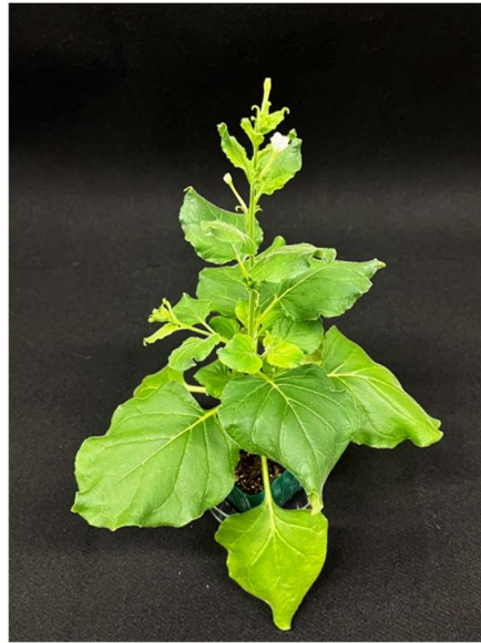
図 1 ベンサミアナタバコ

ベンサミアナタバコ ( Nicotiana benthamiana 、図 1、以下「 N. benthamiana 」) は、植物科学において最も広く用いられている実験モデル植物の 1 つです。多様な植物病害、特に植物ウイルス病に対して感受性が高い (病気にかかりやすい) ため、植物病理学においては古くから研究対象となってきました。最近では COVID-19 のワクチン製造へ利用できるということで注目されています。一方、これまでの研究により、 N. benthamiana は植物の接木において高い接着力を持っており、植物ではこれまで実現が不可能であるとされていた、異なる科に属する植物間の接木 (異科接木) が可能であることが示されました。