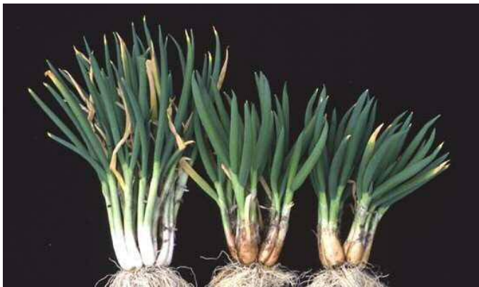
図2 ネギ（左）にシャロット第5染色体を添加した系統（真ん中、右）